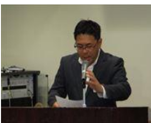
小山会員出席報告