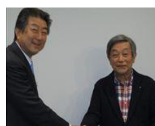
熊澤会員誕生祝い