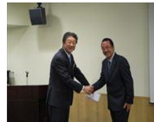
相馬会員のEPP寄付に対する感謝の書贈呈