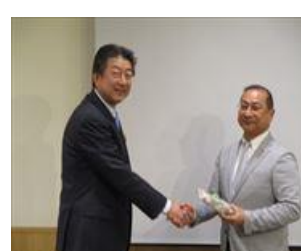
野崎会員誕生祝い