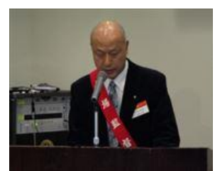
大村会場監督ゲスト紹介