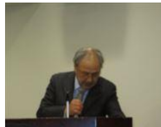
内田会員スマイル報告