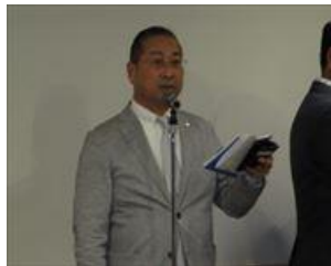
野崎プログラム委員長