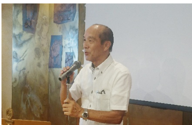
池亀クラブ戦略委員長