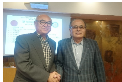
出席表彰 水口会員