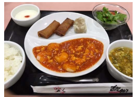
◇本日の食事：西安餃子