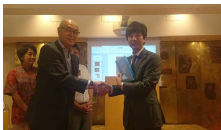
誕生日お祝い 中川会員