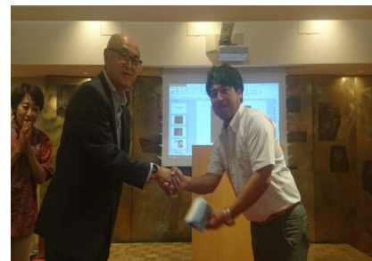
誕生日お祝い 阿波連会員