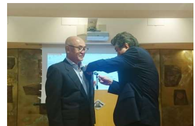
会長バッチ引継ぎ