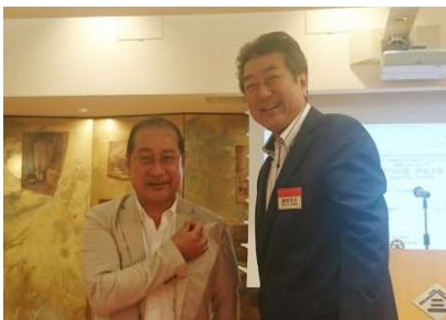
幹事バッチ引継ぎ